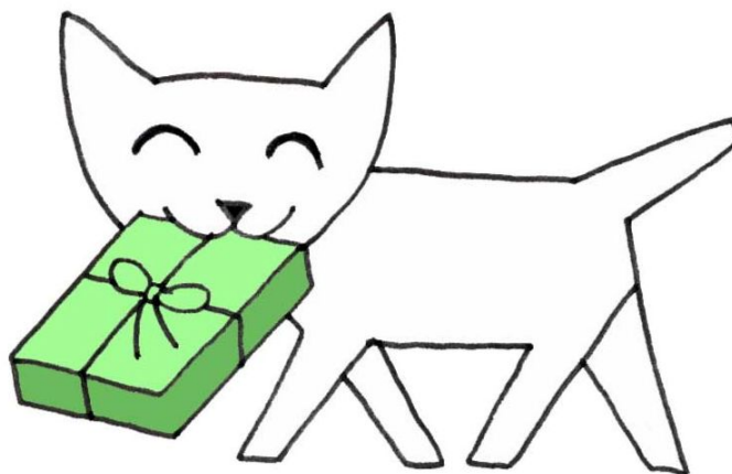
おくりもの イラスト②