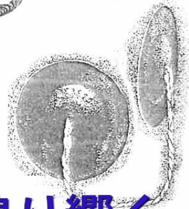
鳴り響く シンバル